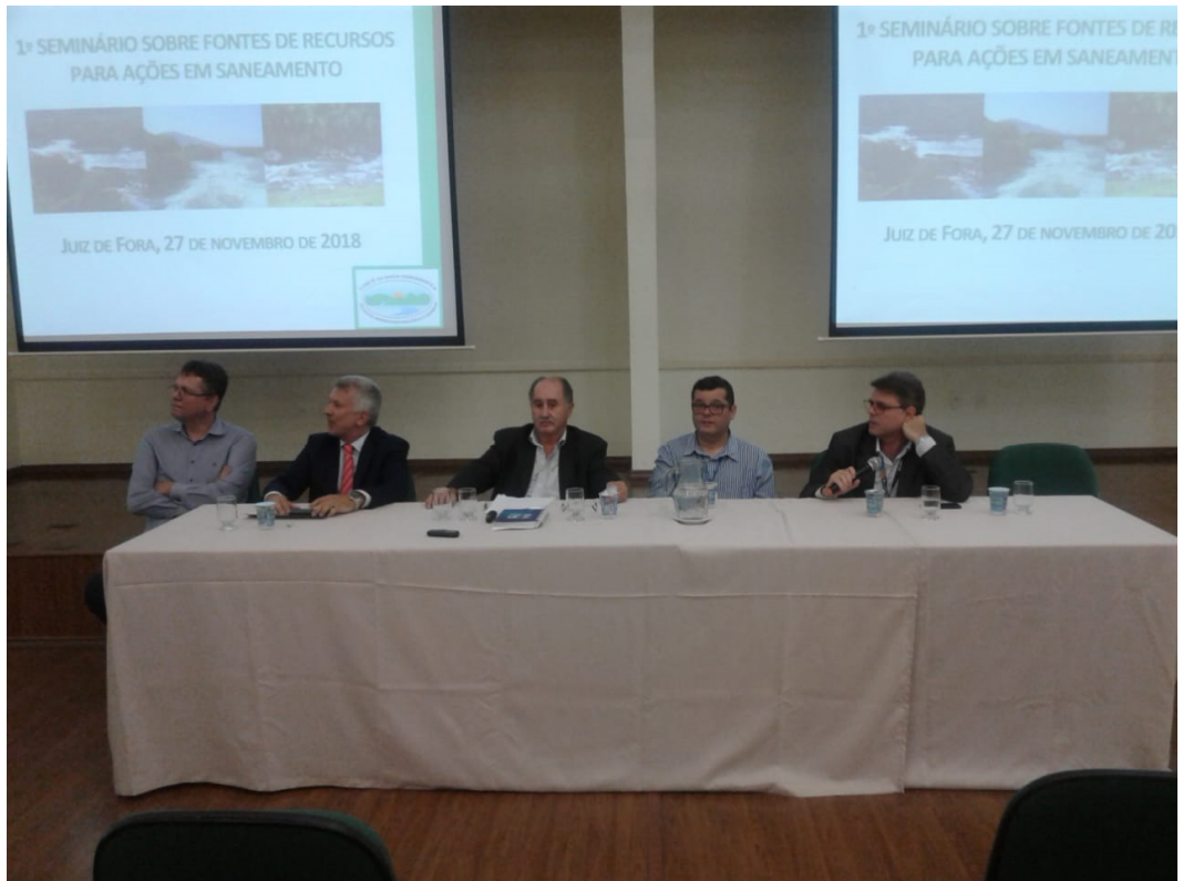
Figura 3. 2ª Reunião Extraordinária do Preto e Paraibuna, em 27.11.2018, em Juiz de Fora/MG