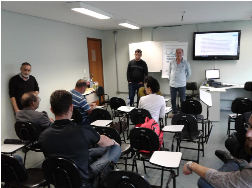
Figura 2. 1ª Reunião Ordinária do Preto e Paraibuna, em 25/10.2018, em Juiz de Fora/MG