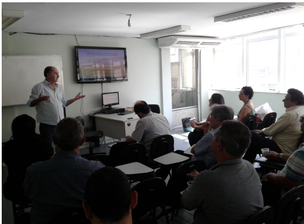
Figura 1. 1ª Reunião Extraordinária do Preto e Paraibuna, em 26.09.2018, em Juiz de Fora/MG

Assim como em 2017, a AGEVAP enfrentou algumas dificuldades para o bom cumprimento do Contrato de Gestão no decorrer de 2018. Principalmente em função da indefinição do processo eleitoral, pois a antiga composição do Comitê optou por não deliberar sobre a aplicação dos recursos da cobrança em ações finalísticas, tendo em vista o processo eleitoral em curso. Portanto, somente em julho de 2018, quando da publicação do ato governamental de posse dos membros eleitos no Processo Eleitoral iniciado em 2017, é que o Comitê voltou a reunir-se para tratar de investimentos.