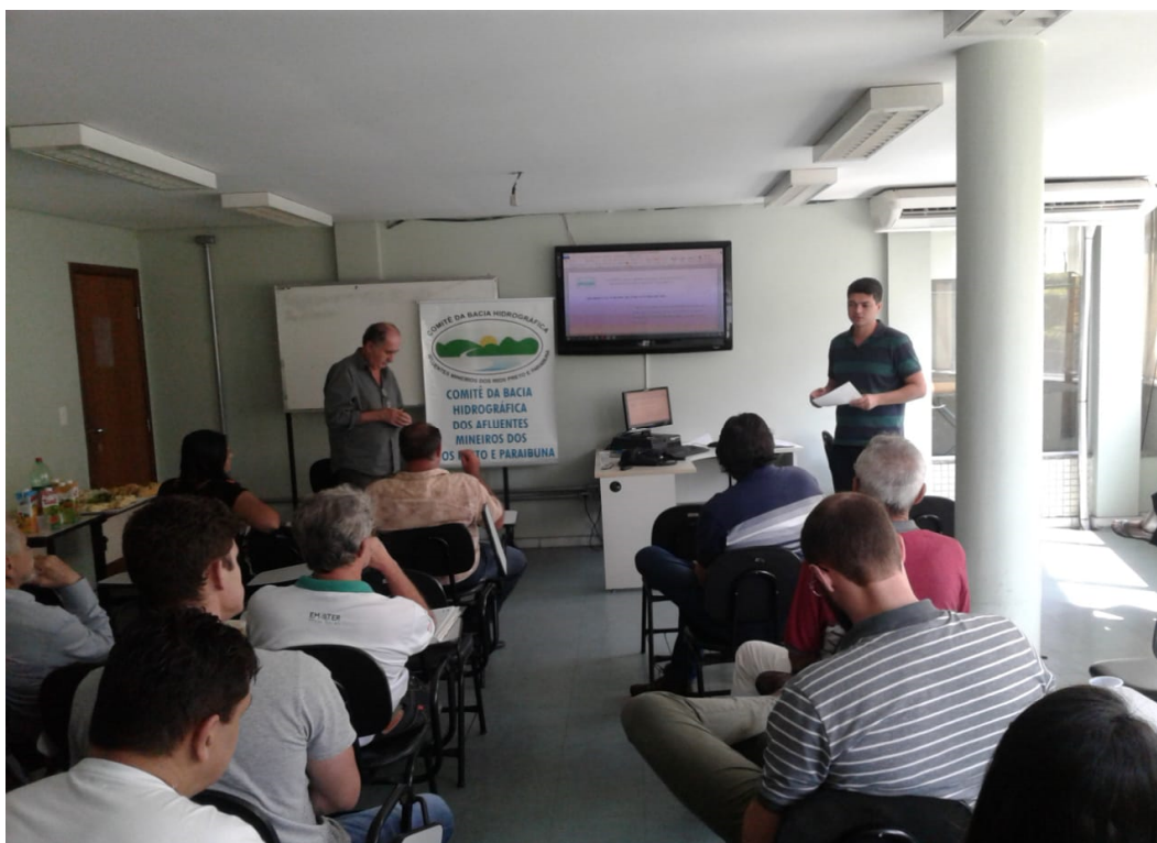
Figura 4. 3ª Reunião Extraordinária do Preto e Paraibuna, em 13/12/2018, em Juiz de Fora/MG