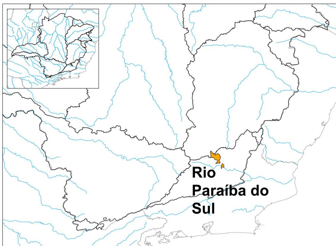
Figura 2: Localização dos municípios que solicitaram decreto de situação de emergência

De acordo com o boletim da Defesa Civil os municípios que solicitaram decreto de situação de emergência foram 171, sendo que na Bacia do Rio Paraíba do Sul foi somente 1, conforme figura e tabela abaixo.